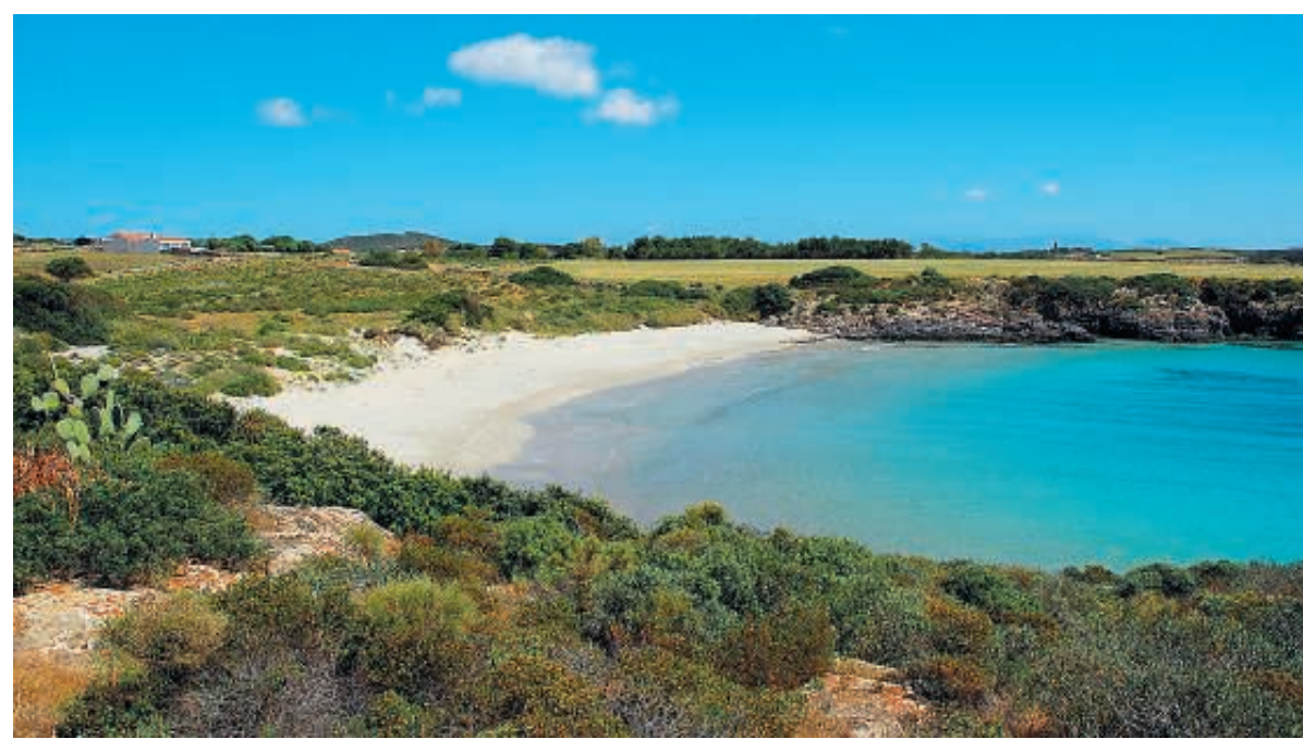
Il regno del tonno L'isola di San Pietro e Carloforte (nella foto in basso): un vero paradiso per i turisti.

Estremo Oriente Un paese ricco di contrasti culturali dove il post-moderno si innesta su una millenaria tradizione