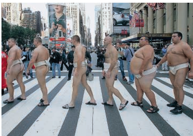
Modernità e tradizione Lottatori di sumo a passeggio nella metropoli.

struggente che paiono usciti da stampe antiche, con verdissime foreste montane, risaie terrazzate, case rurali con il tetto di paglia, paesini e borghi dove l'orologio si è fermato da secoli, castelli e fortezze di legno risalenti al Medioevo e all'epopea romantica dei samurai, templi, pagode e monasteri buddisti e shintoisti, veri capolavori d'arte e meta di pellegrinaggi a riprova di una fede e di una spiritualità ben radicate, nonostante il progresso. Un po' più grande dell'Italia, ma con una popolazione più che doppia e una densità tra le più alte (343 ab/km2), il Giappone è un arcipelago al largo delle coste orientali asiatiche situato tra il mare omonimo e l'oceano Pacifico, di fronte a Russia, Corea e Cina. Disposto in un arco lungo oltre 3 mila km, è formato da quattro isole principali ravvicinate (e dal 1988 collegate tra loro da ponti e