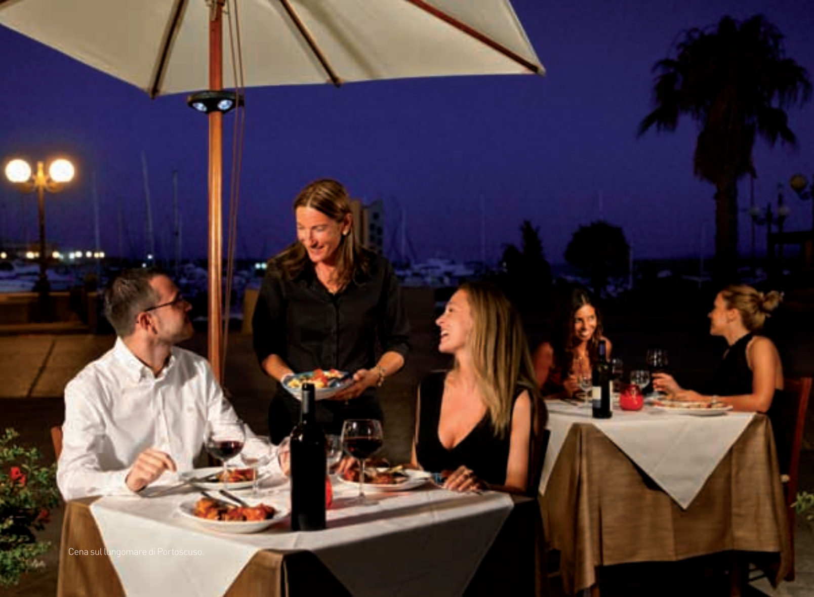
Cena sul lungomare di Portoscuso.