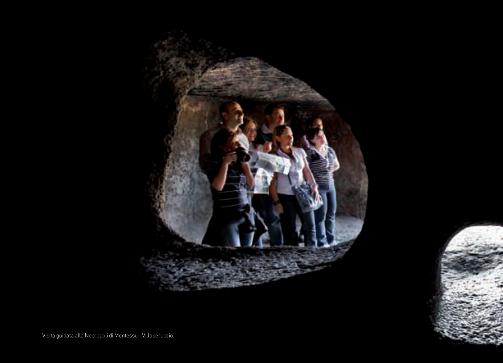
Visita guidata alla Necropoli di Montessu - Villaperuccio.