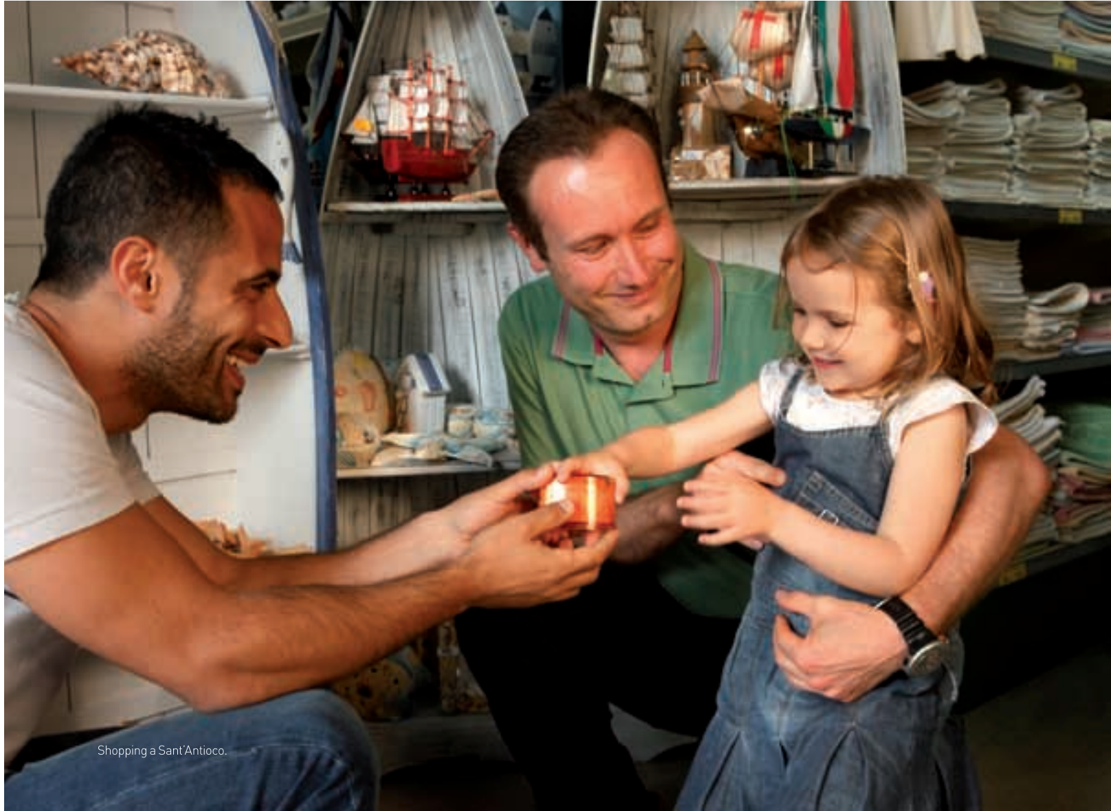
Shopping a Sant'Antioco.