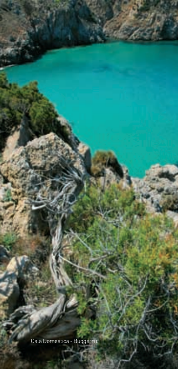
Cala Domestica - Buggerru.