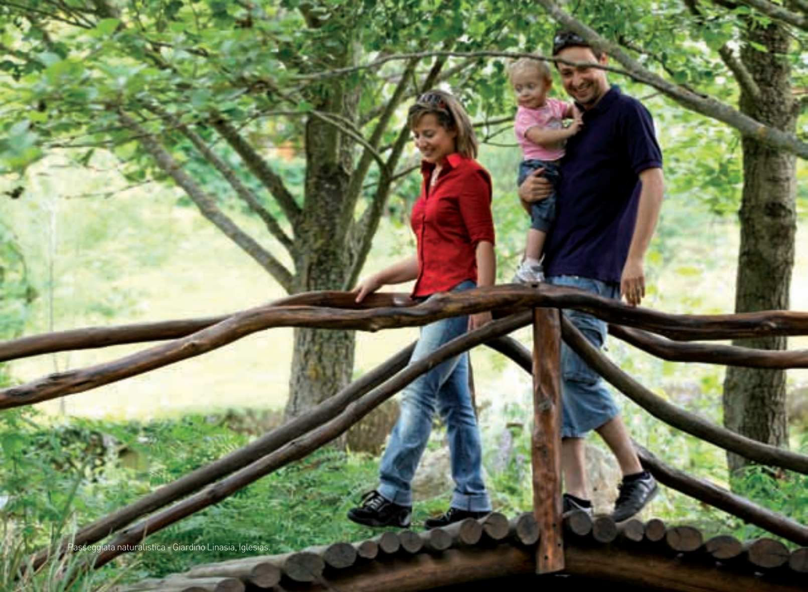
Passeggiata naturalistica - Giardino Linasia, Iglesias.