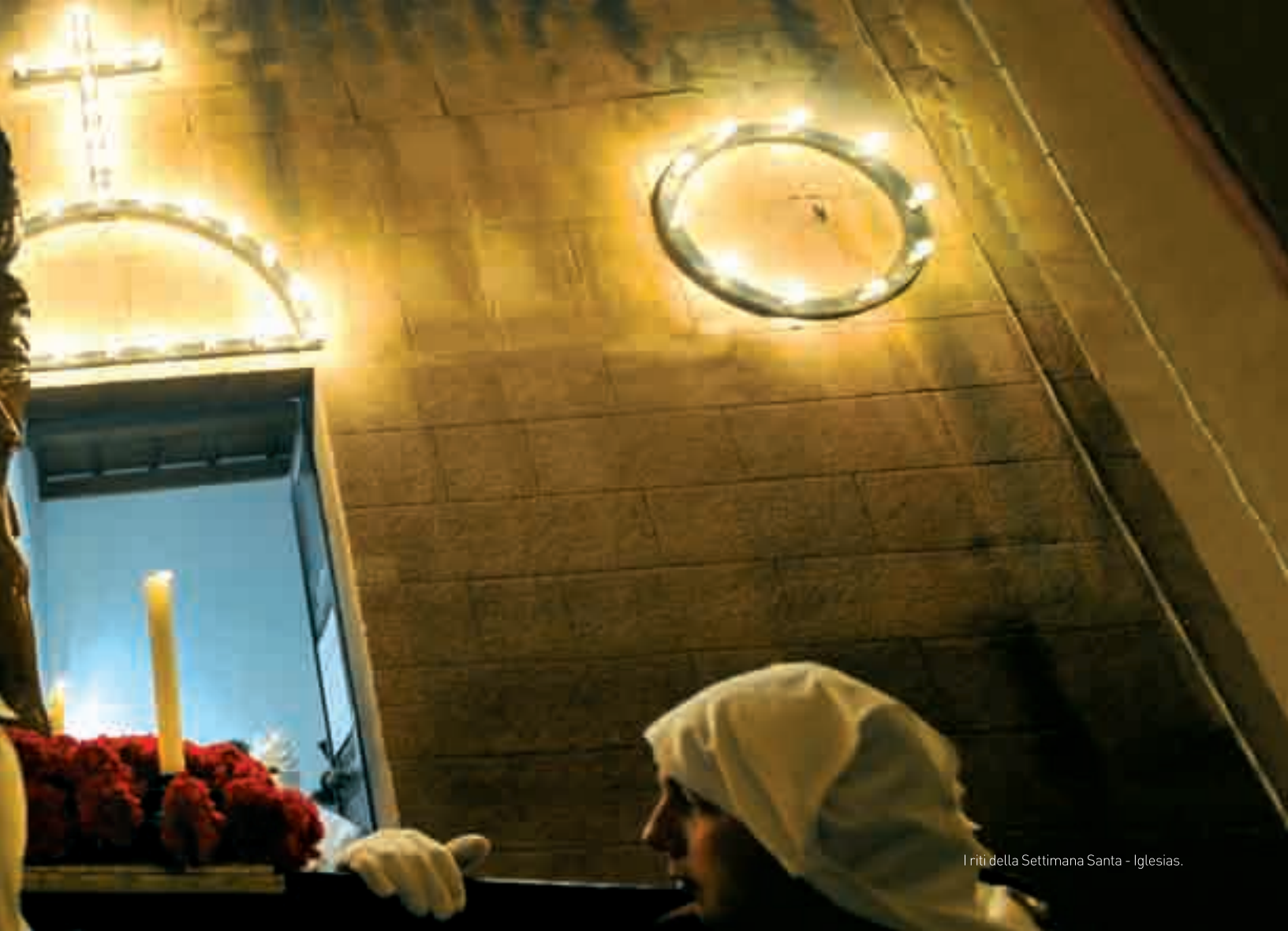
I riti della Settimana Santa - Iglesias.