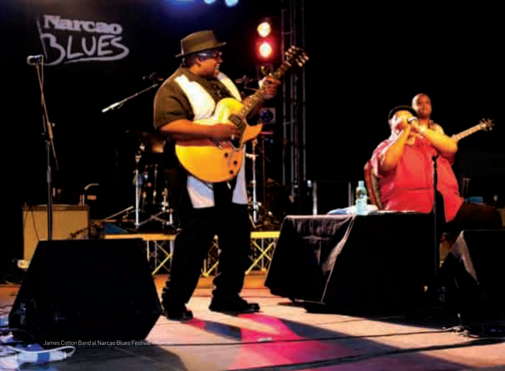
James Cotton Band at Narcao Blues Festival - Narcao.