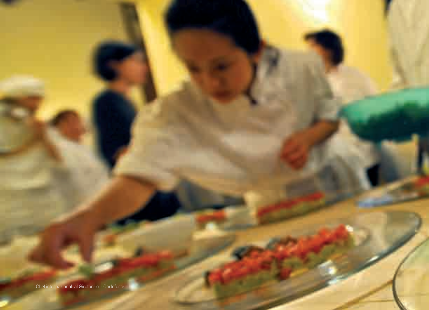
Chef internazionali al Girotonno - Carloforte.