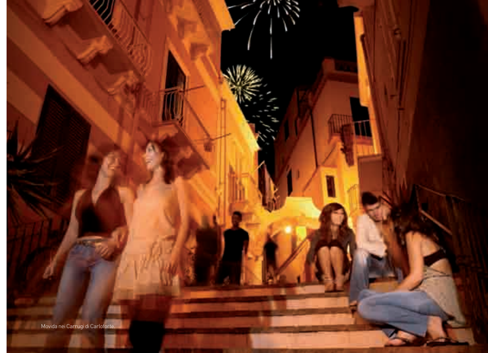
Movida nei Carrugi di Carloforte.