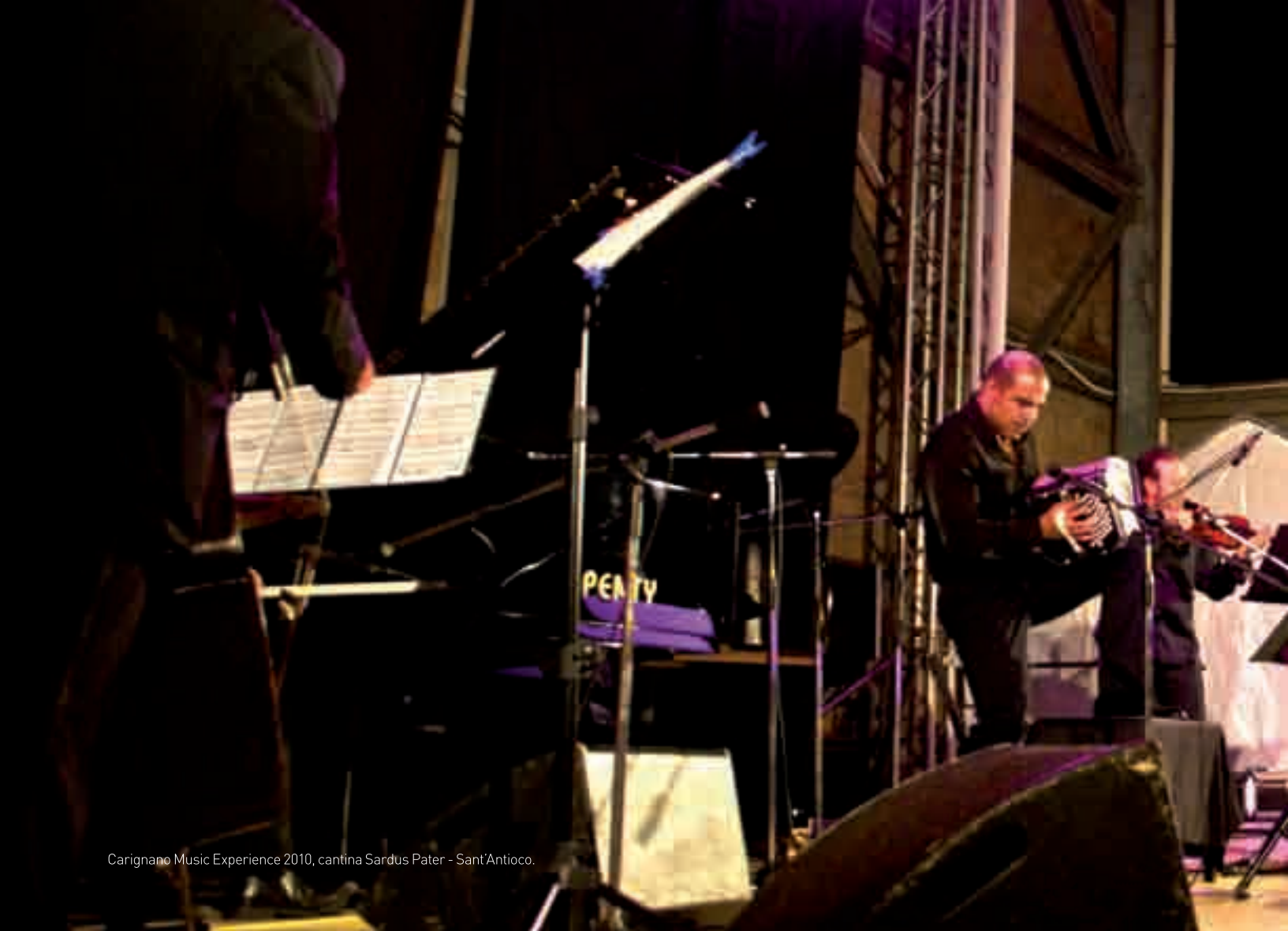
Carignano Music Experience 2010, cantina Sardus Pater - Sant'Antioco.